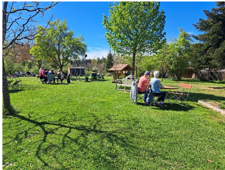
15. Gartenwirtschaft Bauernstube Litz, Feudental