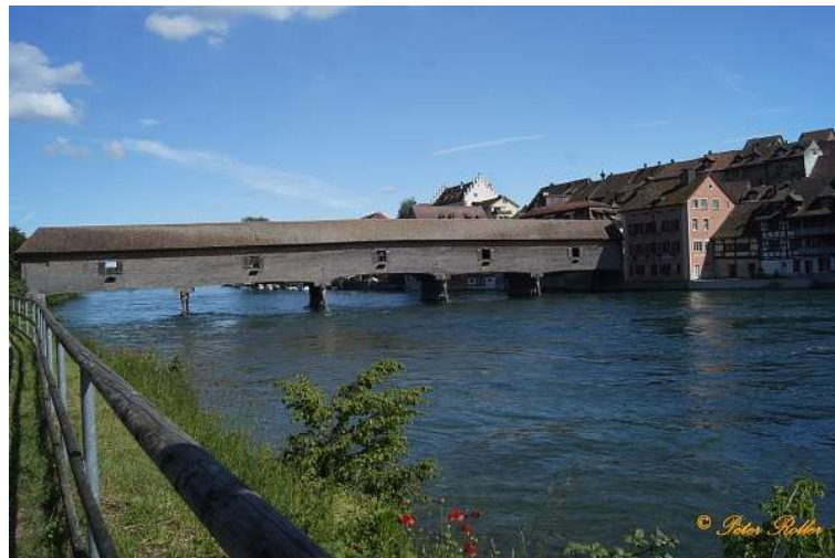
8. Rheinbrücke Gailingen-Diessenhofen (D)