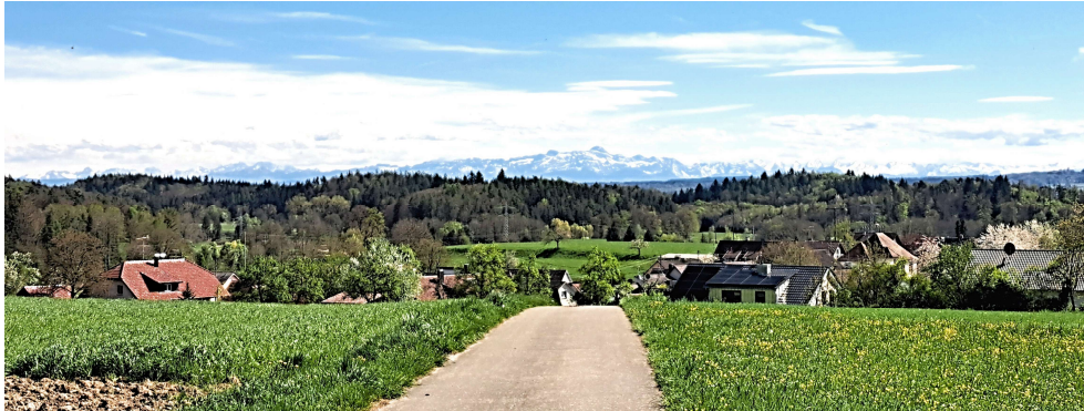
14. Blick vom Bodanrück in die Schweiz