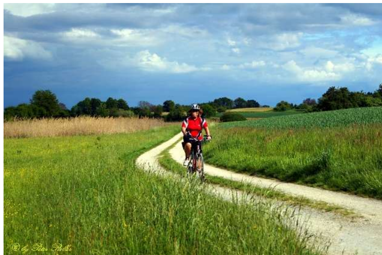
1. Weg von Gundholzen nach Horn