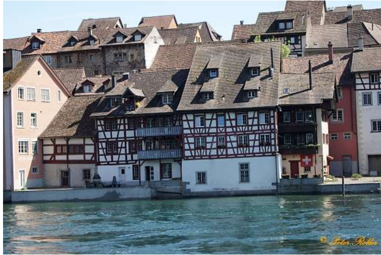
9. Diessenhofen (CH)

!!! An der Brücke, befindet sich ein nettes, kleines Gartenlokal