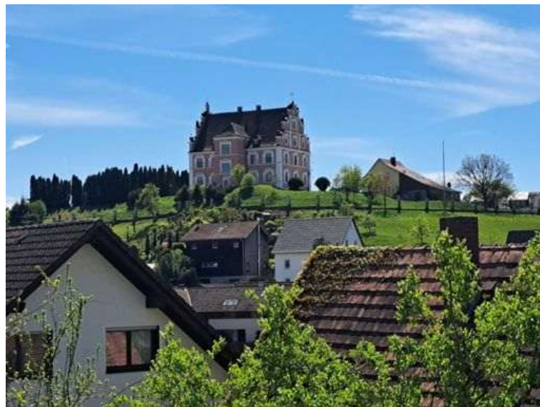
13. Schloss Freudental