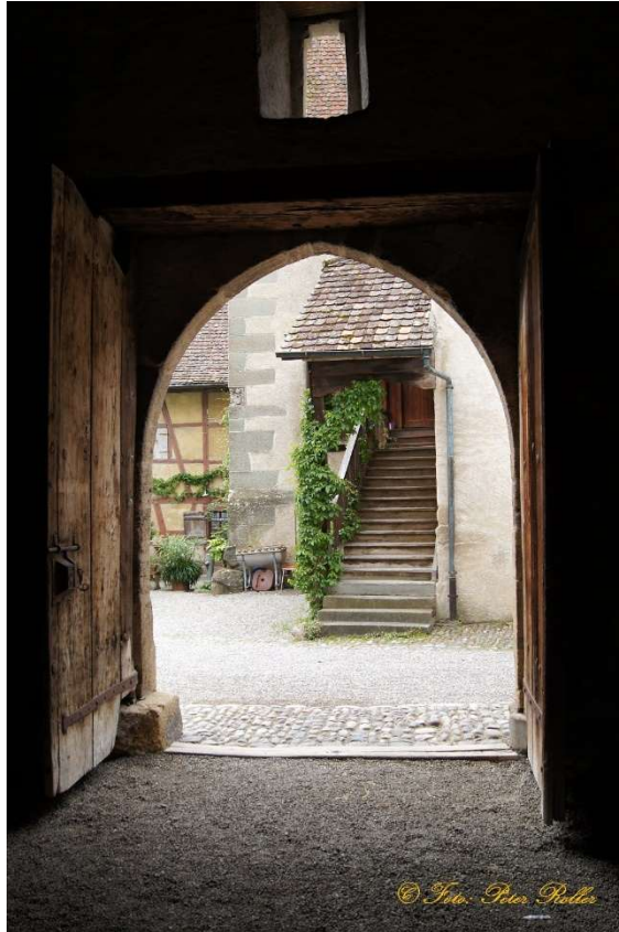
4. Im Klostermuseum Stein am Rhein