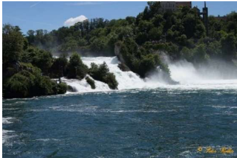
6. Rheinfall Schaffhausen