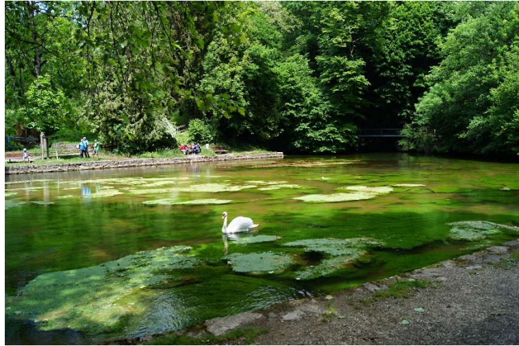
11. Radolfzeller Ach-Quelltopf