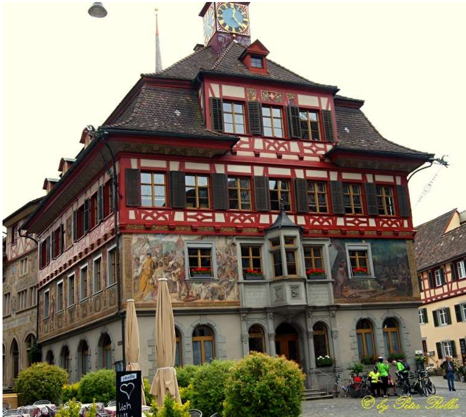
2. Stein am Rhein