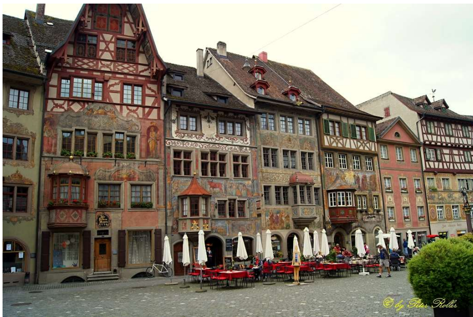
3. Häuserzeile Stein am Rhein