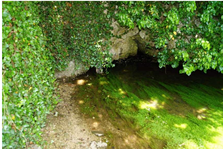
10. Radolfzeller Aach-Quelle

Aach-Quelle liegt im Hegau, unweit von Engen. Sie ist die wasserreichste Quelle Deutschlands. Sie mündet bei Radolfzell im Aach Ried in den Bodensee. Die hier gewählte Route wurde so gewählt, dass Steigungen weitgehend vermieden werden.