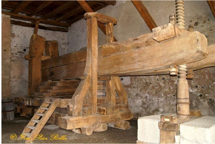
5. Weinpresse im Klostermuseum Stein am Rhein